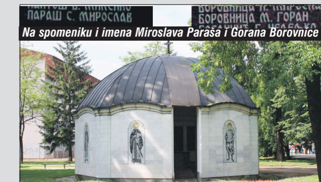
U parku Srednjoškolskog centra u Prijedoru 2012. podignut spomenik palim srpskim borcima

Za Parašu je van razumne sumnje u Sudu BiH utvrđeno da je bio komandir Interventnog vođa prijedorske policije. Ta jedinica u cijelosti je počinitelj zločin, a sam Miroslav Paraša, prema tvrdnjama optuženih policajaca, također je učestvovao u strijeljanju civila. Među 200 muškaraca koji su izvedeni iz konvoja nalazio se i Elvir Kararić, dječak od 16 godina iz Trnopolja. Identificiran je na osnovu posmrtnih ostataka pronađenih u provaliji dubokoj 200 metara.