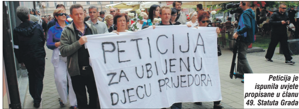
Peticija je ispunila uvjete propisane u članu 49. Statuta Grada

Peticiju je samo tokom 2014. godine potpisalo 1.175 građana Prijedora, a podršku je dalo još 242 ljudi iz drugih mjesta. S velikim brojem pot-