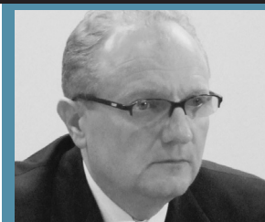
Piše: Profesor Emir RAMIĆ

Pozivaju sve prijatelje istine i pravde u svijetu da obilježe Međunarodni dan bijelih traka, 31. maj. Nosite oko ruke bijele trake, koje nisu samo simbol sjećanja