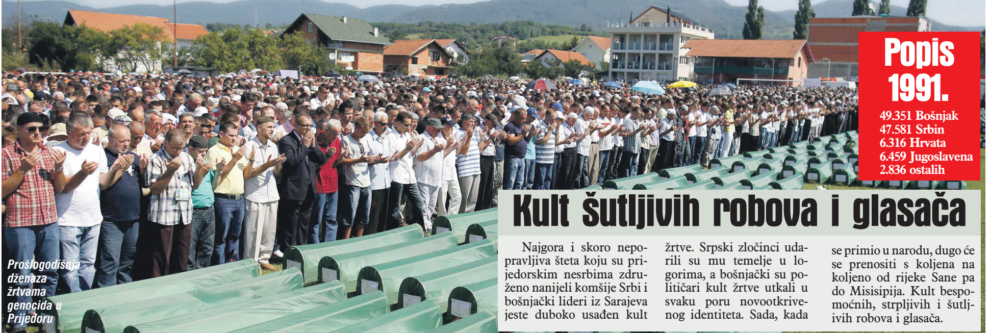
Prošlogodišnja džezaza žrtvama genocida u Prijedoru

(Autor je aktivista za ljudska prava iz Prijedora)