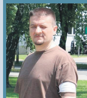
Piše: Edin RAMULIĆ

pranja novca kroz kantonalne i federalne fondove. Članovima 195 porodica civilnih žrtava iz Prijedora oduzeta je invalidnina zato što su se vratili u Prijedor s prostora Federacije BiH. Taj status vraćen im je tek prije dvije godine, ali je poruka bila više nego jasna, bili su 15 godina kažnjeni zbog povratka.